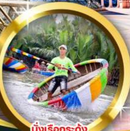
นั่งเรือกระดิ่ง