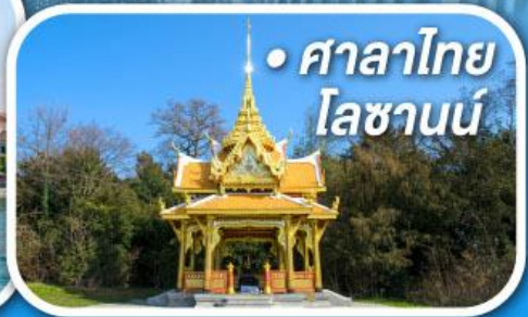
• ศาลาไทย โลซานน์

• สุดอากาศดีที่เซอร์แมท • ขึ้นกระเช้าสู่ยอดจากลาเซียร์ 3000 • ชมเมืองคลาสสิกเบิร์น ลูเซิร์น ซูริก 17-23 ก.ย. / 01-07, 07-13, 13-19, 21-27 ต.ค. 69 05-11 พ.ย. 69 26 พ.ย. - 02 ธ.ค. 69