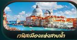
เวนิสเมืองแห่งสายน้ำ