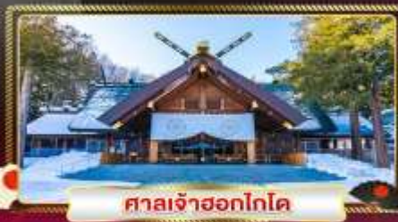
ศาลเจ้าซอกโกโด