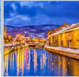
"OTARU CANAL FEST"