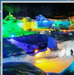
“SOUNKYO ICE FEST”