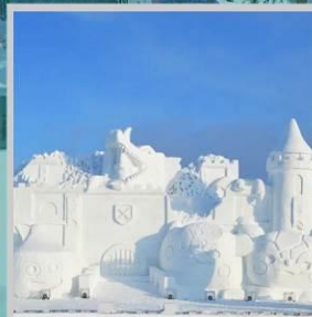
“ASAHIKAWA SNOW FEST”