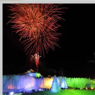
"SOUNKYO ICE FEST"