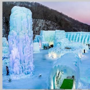
"LAKE SHIKOTSU FEST"