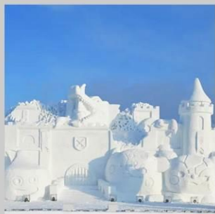
"ASAHIKAWA SNOW FEST"