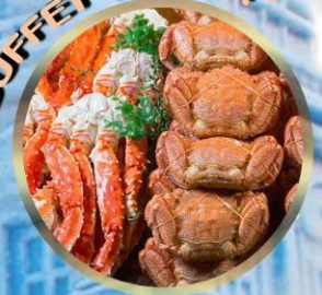
SAPPORO SNOW FESTIVAL 2027