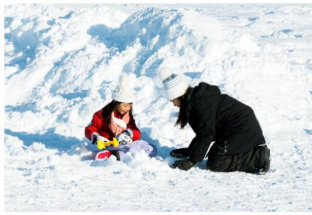
Playing in the snow