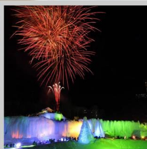
"SOUNKYO ICE FEST"