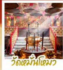
วัดเมื่อนไทมว