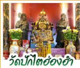
วัดปิกไต้ย่องฮ่า