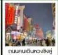
ถนนคนเดินหวงชิ่งคู่