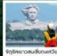
จัดรีเสียวซนเซียงกงสวี

จางเจียเจีย เฟิ่งหวง • ฟ่านจิ้งซาน • ฉางซา