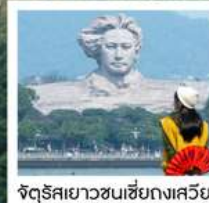
จัตุรัสยาวขนเซี่ยงกงเสวีย

จางเจียเจีย เฟิ่งหวง • ฟ่านจิ้งซาน • ฉางซา