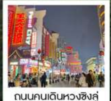
ถนนคนเดินหวงชิ่งลู่