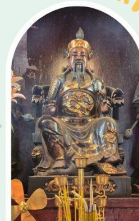
วัดปักไต