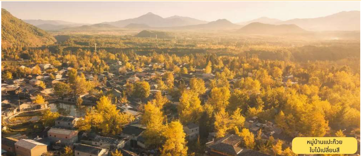
หมู่บ้านแปะก๊วย ใบไม้เปลี่ยนสี

อุทยานน้ำพุร้อน (รวมรถราง) - อุทยานทุ่งหญ้าลอยน้ำไป๋ไห่ (รวมรถราง) - หมู่บ้านแปะก๊วยชมใบไม้เปลี่ยนสี - เมืองโบราณหะซุ่น