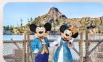
อีสรະตามอริยาศัย 1 วัน