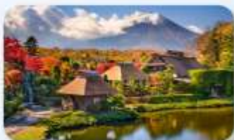
หมู่บ้านน้ำใสโอชิโนะฮักไต

FUJI HOTEL AREA หรือเทียบเท่า NARITA HOTEL AREA หรือเทียบเท่า NARITA HOTEL AREA หรือเทียบเท่า