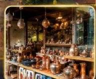
เลือกรื้อของฝากงานหัตถกรรมพื้นเมือง

สัมผัสเสน่ห์แห่งอดีตในเมืองที่เวลาเดินช้าลง กับสถาปัตยกรรมอันงดงาม วัฒนธรรมที่ยังคงมีชีวิต และความอบอุ่นจากผู้คน