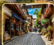
เดินเล่นย่านเมืองเก่าบรรยากาศย้อนยุค