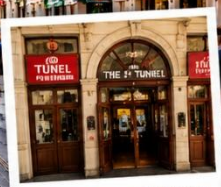
สถานีทูเนล (TUNEL STATION) สถานีรถไฟใต้ดินสายเก่าแก่ และเป็นหนึ่งในระบบขนส่งที่เก่าแก่ที่สุดในโลก