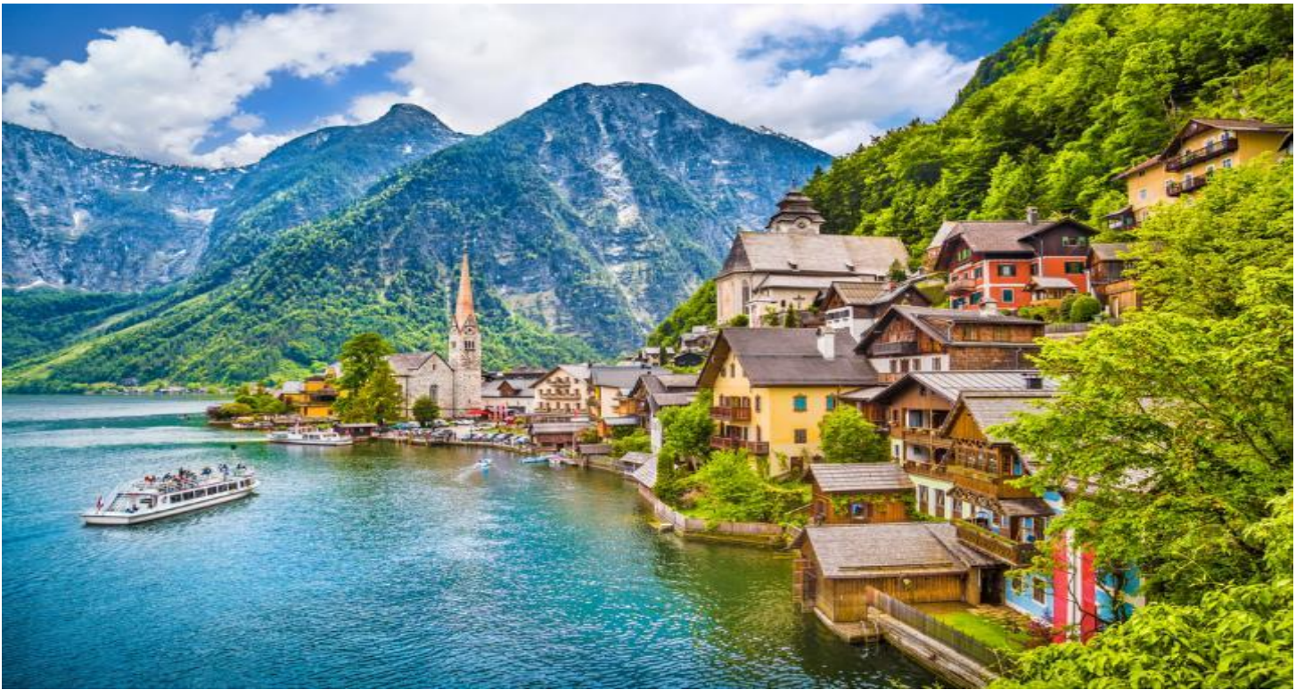
กลางวัน รับประทานอาหารกลางวัน ณ ภัตตาคารพื้นเมือง (ปลาจากทะเลสาบฮัลสตัท)