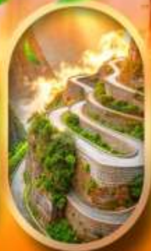
หุบเขาป้ายช้าง