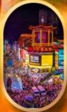
ถนนคนเดินซิงลู่