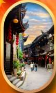
เมืองโบราณฟูหลงเจี้ยน