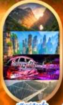
พรีเซนเลือกซื้อ Option เสริม