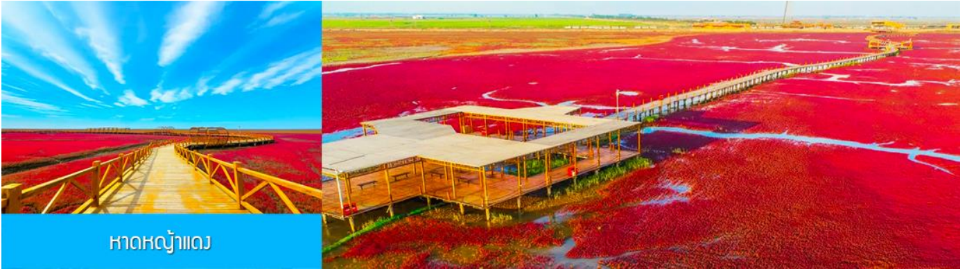
หาดหญ้าแดง

เช้า รับประทานอาหารเช้า ณ ห้องอาหารของโรงแรม (10) หลังอาหารเช้านำท่านเดินทางสู่ เมืองผานจิน 盘锦 (ระยะทาง 170 กม. ใช้เวลาเดินทางราว 2 ชั่วโมงเศษ)