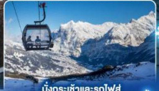
นั่งกระเช้าและรถไฟสุด อลเวงจากุงเฟรา