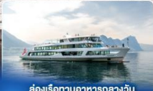
ล่องเรือทานอาหารกลางวัน ทะเลสาบลูเซิร์น