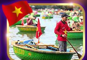
เรือกระด้ง หมู่บ้านกิมทาน