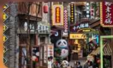
หมู่บ้านสีปาที