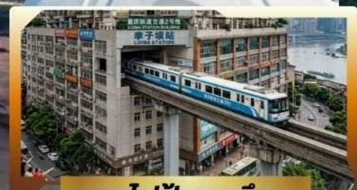
รถไฟฟ้ากะลุดัก