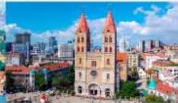
โบสถ์คริสต์เซนต์ไมเคิล

*ทางบริษัทฯ ขอสงวนสิทธิ์ในการสลับโปรแกรมทัวร์ตามความเหมาะสมขึ้นอยู่กับสถานการณ์หน้างาน โดยคำนึงถึงผลประโยชน์ของลูกค้าเป็นสำคัญ