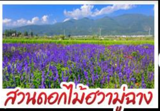
สวนดอกไม้ฮาวู๋ฉ่าง