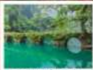
อุทยานเสี่ยวซีหลง