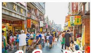
เมืองโบราณต้าซี