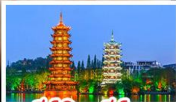
เจดีย์เงินเจดีย์ทอง