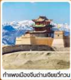
กำแพงเมืองจีนด่านเจี๋ยวี่กวน