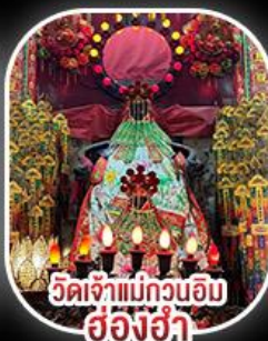
วัดเจ้าแม่กวนอิม สงฮ่า