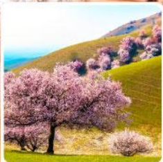
ทุ่งดอกอัลมอนต์