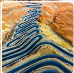
ถนนผานหลงกู่ต้าว