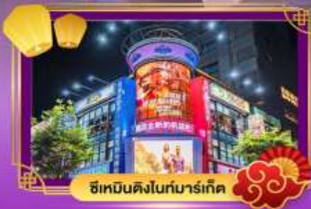
ซีเหมินดิงไนท์มาร์เก็ต