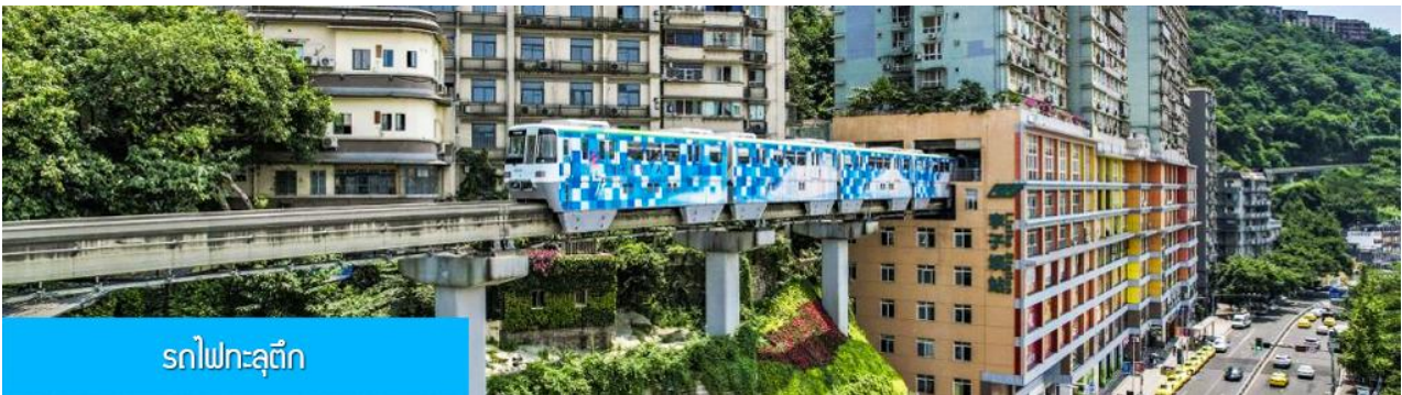
รถไฟทะลุตึก