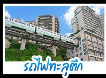
รถไฟทะลุคิ๊ง