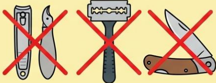
กรรไกรตัดเล็บ (Nail Clippers) มีดโกน (Razor) มีดพับ (Folding Knife)