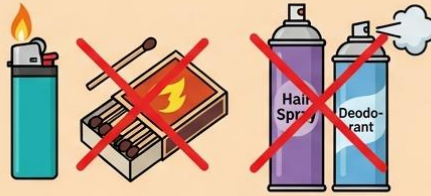
ไฟแช็ก, ไม้ขีดไฟ (Lighter, Matches) สเปรย์หรือกระป๋องอัดแก๊สทุกชนิด