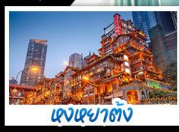
แสงเซาตัง