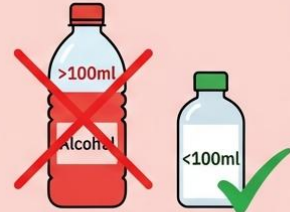
ของเหลว/แอลกอฮอล์เกิน 100 มิลลิลิตร