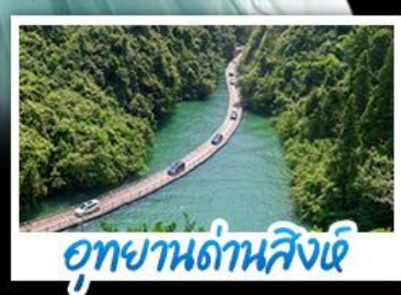
อุทยานด่านสิงห์