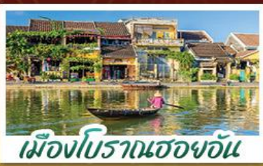
เมืองโบราณเฮอจอัน

! พักบนเขานาฮิลล์ 1 คืน ! สัมผัสอากาศเย็นตลอดปี สตรีตฟรังเศสสุดคลาสสิก - นั่งกระเช้ายาวที่สุด สูบานาฮิลล์ สนุกสุดมันส์ไปกับสวนสนุก The Fantasy Park นมัสการเจ้าแม่กวนอิมองค์ใหญ่ที่สุดของเมืองดานัง - เช็กอินเมืองมรดกโลกฮอยอัน - สนุกสนานไปกับกิจกรรม!!นั่งเรือกระดิง หมู่บ้านกัมถาน เช็กอินร้านคาเฟ่ SON TRA MARINA CAFE - ไม่หลงร้านช้อปปิ้ง - อิ่มอร่อยกับบุฟเฟ่ต์นานาชาติ , หม้อไฟซีฟู้ด