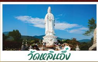
วัดเข็กินอั้ง