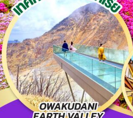
OWAKUDANI EARTH VALLEY