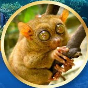
ลิงทาร์เซีย