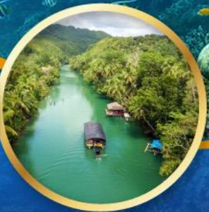
ล่องเรือแม่น้ำโลบ็อก