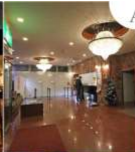
Asia Narita Hotel