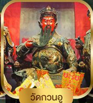
วัดกวนอู