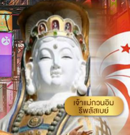
เจ้าแม่กวนอิม ธิพัลลิมเบย์