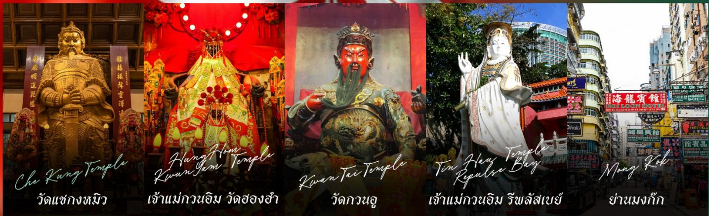
Che Kung Temple วัดแชกงงทมิว

รายการทัวร์ข้างต้นอาจมีการปรับเปลี่ยนเพื่อความเหมาะสม