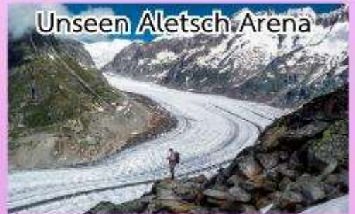
Unseen Aletsch Arena

ชมความงดงามของทะเลสาบเจนีวา ชมปราสาทชิลองที่เมืองมอว์คเทออร์ช ล่องเรือชมความงามของทะเลสาบ ลูเซิร์น, พักในหมู่บ้านเซอร์แมท (เมืองตากอากาศปลอดมลพิษ ที่ได้ ชื่อว่าสวยงามเหมือนสวรรค์บนดิน)