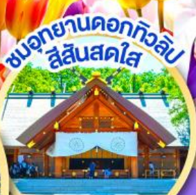
ชมอุทยานดอกทิวลิป สี่สีแสนสดใส