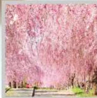
"NICCHUSEN WEEPING SAKURA"