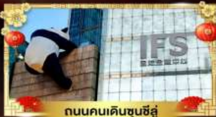
ถนนคนเดินชุนชี่อู่

เที่ยวอุทยานสวรรค์ระดับ 5A จี๋จ้ายโกว "กู๋เขาสีดรุณี" อุทยานชื่อดังเหนียงชาน