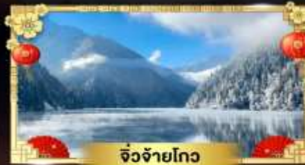
จี๋จ้ายโกว